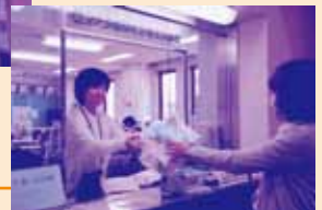
社会福祉協議会 事務局窓口