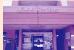
長泉町 社会館玄関

こちらで寄付をしてくれた方のお名前を、やさしい心ありがとうに掲載しています。名前をのせなくてよいです、という方は匿名として掲載しています。