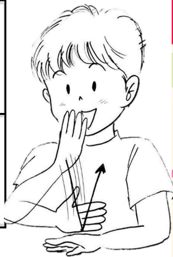
「ありがとう」の手話表現