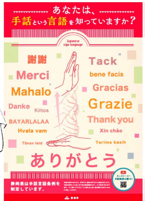
静岡県条例啓発ポスター